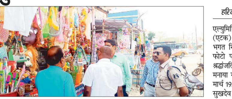
निरीक्षण करते पुलिस कर्मी।