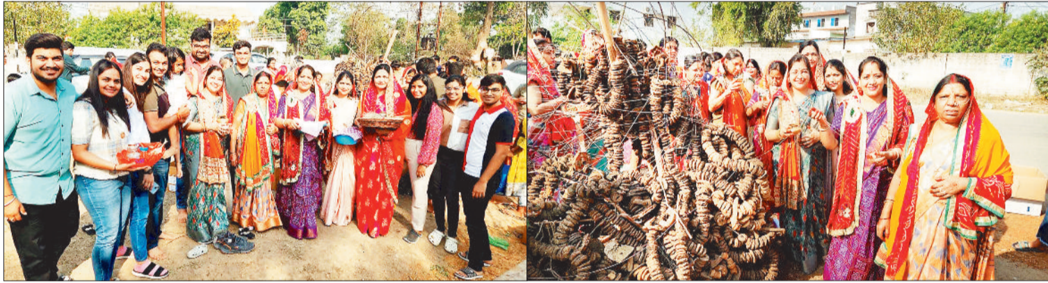
होली दहन के पूर्व होलिका की पूजा अर्चना करती महिलाएं एवं श्रद्धालु।