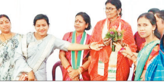
जनसंपर्क के दौरान कांग्रेस प्रत्याशी ज्योत्सना महंत।

कांग्रेस लोकसभा प्रत्याशी ज्योत्सना महंत का लगातार जनसंपर्क कार्यक्रम जिले के विभिन्न क्षेत्रों में किया जा रहा। इसी दौरान कांग्रेस प्रत्याशी ने बालको नगर वार्ड 36 भद्रापारा में भी जनसंपर्क कार्यक्रम के दौरान