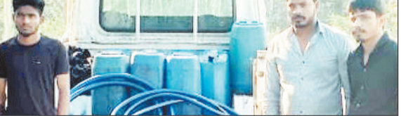
पुलिस गिरफ्त में आरोपी व जप्त कैपर व डीजल।