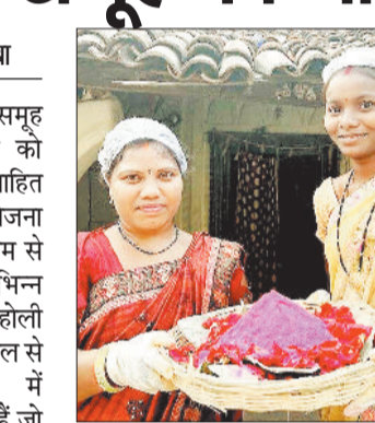
एसएचजी महिलाएं शामिल हैं जो होली पर स्वास्थ्य एवं पर्यावरणीय जिम्मेदारियों के प्रति भी सचेत रहने को सीख दे रही हैं। पौधों की जड़ों और उसके पत्ते से निकाले गए प्राकृतिक रंग हमारी त्वचा के लिए सुरक्षित हैं। पर्यावरण के प्रति जागरूक को बढ़ावा देता है। उन्नति के गुलाल बायोडिग्रेडेबल और पर्यावरण के

बालको ने स्व-सहायता समूह (एसएचजी) की महिलाओं को गुलाल बनाने के लिए प्रोत्साहित किया। कंपनी के उन्नति परियोजना के अंतर्गत प्रशिक्षण के माध्यम से एसएचजी सदस्यों ने विभिन्न उत्पाद बनाना शुरू किया है। होली त्योहार के मौके पर बनाये गुलाल से महिलाओं के जीवन में आत्मनिर्भरता के रंग भर गए हैं जो आय सृजन के लिए उनके अतिरिक्त खेत का जरिया बनके