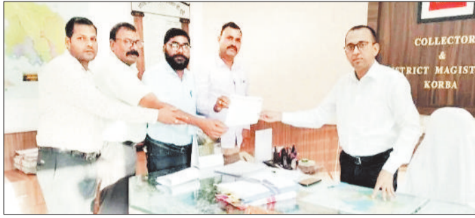
कलेक्टर को ज्ञापन सौंपते टीचर्स एसोसिएशन।

लोकसभा चुनाव ड्यूटी में लगे कर्मचारी अधिकारियों को आवश्यक सुविधा प्रदान करने व 55 वर्ष से अधिक उम्र, गंभीर बीमारी से ग्रस्त, शिशुवती, गर्भवती महिला कर्मचारियों को चुनाव ड्यूटी से मुक्त रखने छत्तीसगढ़ टीचर्स एसोसिएशन कोरबा के पदाधिकारियों द्वारा कलेक्टर, जिला निर्वाचन अधिकारी कोरबा मुलाकात कर ज्ञापन सौंपकर चर्चा किया गया।