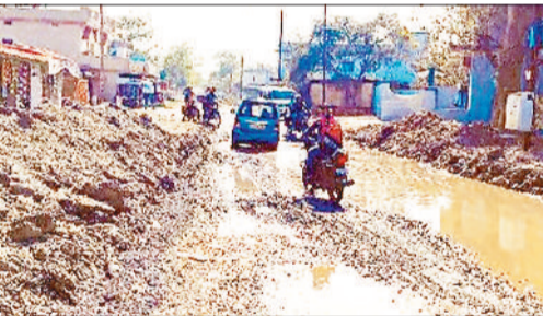
सड़क पर रखा मलबा।

कबीर चौक से गेवरा बस्ती, धरमपुर से लेकर भिलाई बाजार तक के सड़क की हालत किसी से छिपी नहीं है। मुख्य मार्ग के सुधार के नाम पर खुदाई कर 20 दिनों से अधिक