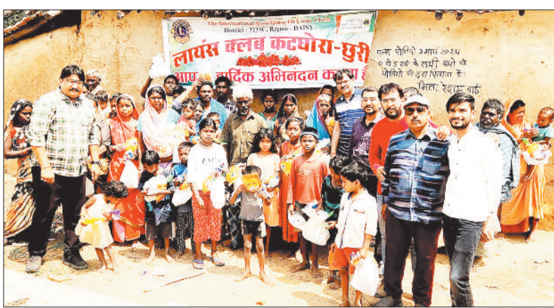
बच्चों को होली सामग्री व मिठाई वितरित लायंस क्लब कटघोरा-छुरी के पदाधिकारी।