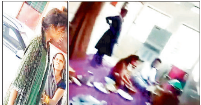
इंतजार करते मरीज व परिजन एवं होली पिकनिक मनाते स्टाफ।

जिले के पाली ब्लॉक के प्राथमिक स्वास्थ्य केंद्र ने स्वास्थ्य विभाग की पोल खोलकर रख दी है। तमाम दावे हवे में लटक नजर आए। प्राथमिक स्वास्थ्य केंद्र में चिकित्सकों की मनमानी देखने को मिली है। चिकित्सक और पूरा स्टाफ मरीजों का इलाज करने की बजाय होली खेलने में मस्त नजर आया है। जिसकी वजह से मरीज व परिजनों को परेशानियों का सामना करना पड़ा। जिले में लोगों के उपर होली का खुरमार किस कदर बढ़ा हुआ है। इस बात का अंदाजा इसी बात से लगाया