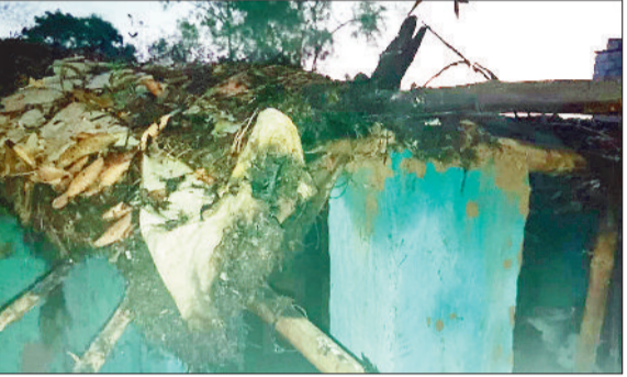
वह घर जहां हुई आगजनी की घटना।